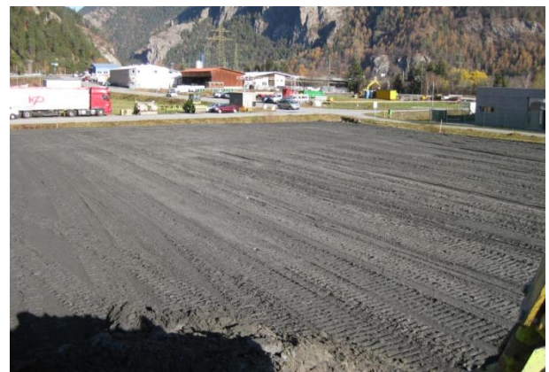
Werkhalle Toscano Unterrealta